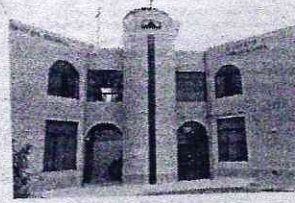
En Transportes los problemas no tienen cuándo acabar.